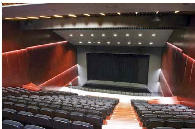
PERSPECTIVA DEL TEATRE MUNICIPAL ÀNGEL GUIMERÀ